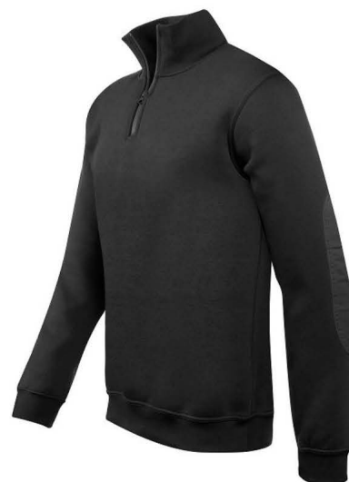
Sweat-shirt col montant zippé